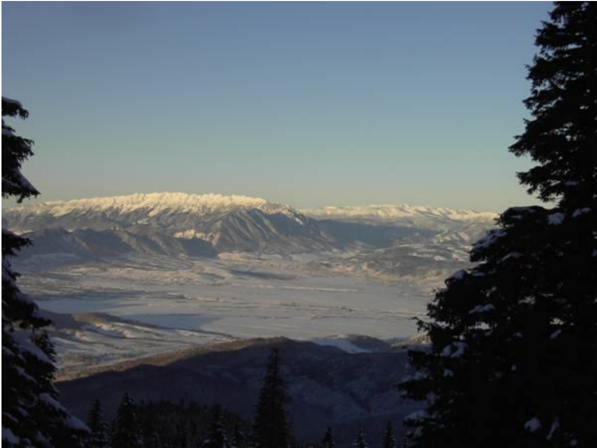
Blick von der Schulerhütte des SKV über das Burzenland zum Königstein und dahinter (rechts) der Beginn des Fogarascher Gebirges.

Im Sommer bietet die Schulerau eine Vielzahl von Möglichkeiten für Wanderungen nach jedermanns Möglichkeiten und Ansprüchen. Z.B. über den Langen Rücken aus der unteren, der Großen Schulerau, über das Goldloch oder den Götzentempel nach Rosenau / Râsnov; verschiedene Wege auf den Schuler – dem Hausberg der Kronstädter- und seine Spitze oder zur Julius Römer-Hütte / Postavaru-Hütte des SKV (1590 m). Am Schuler selbst kann man schönen Wanderwegen folgen: Zur Dreimädelwiese; über die Christianswiese durch die Teufelsschlucht in die Schulerau; über die Lamba hinunter zum Untertömösch u.a.m.