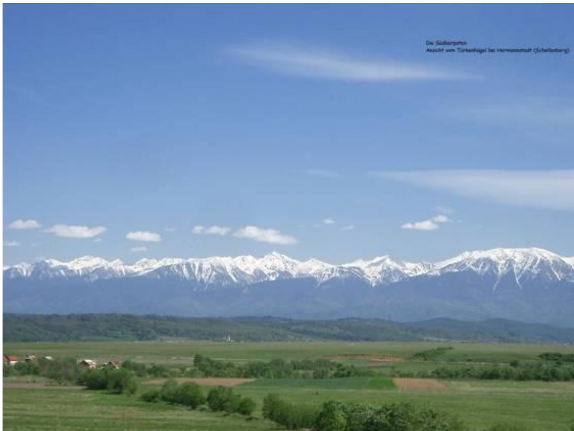
Das Fogarascher Gebirge (in den Südkarpaten).