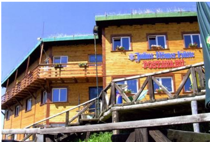
Die Julius-Römer-Hütte des SKV am Schuler