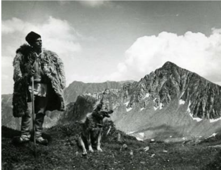
Rumänischer Schäfer

Die Karpaten sind wohl einmalig auch durch die Menschen, denen man hier begegnet. Da trifft man Hirten in Schafpelzen mit ihren zottigen Schäferhunden – die auch Touristen Schreck einjagen können – und ihre Schafsherden, begleitet von Packeseln. Mit etwas Glück kann man in einer „stâna“ (Sennhütte) auch Einblick in das Schäferleben und eine Kostprobe von „jintita“ (saure Schafsmilch) oder Käse in verschiedenen Stadien der Zubereitung („cas“ oder „urda“ – Frischkäsearten, „burduf“ – reifer Schafkäse, „telemea“ – Schafkäse in Salzlake) bekommen.