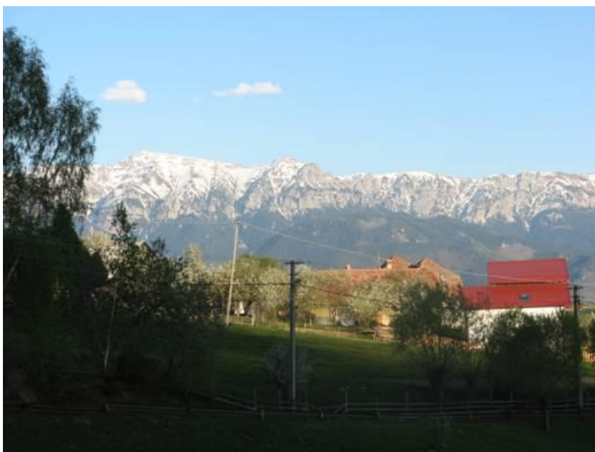
Der Königstein, gesehen von der Magura