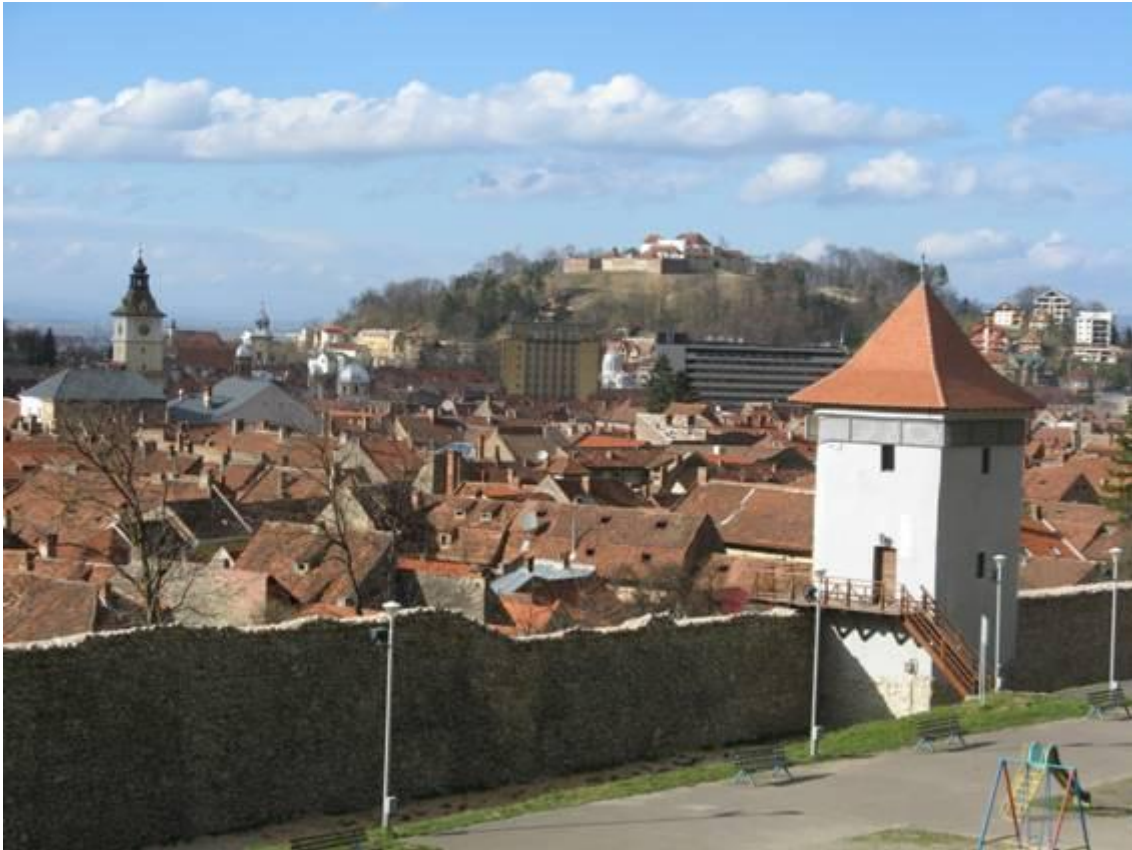
Blick von der Burgpromenade über die Stadtmauer und die Dächer der Inneren Stadt, auf den Schlossberg.