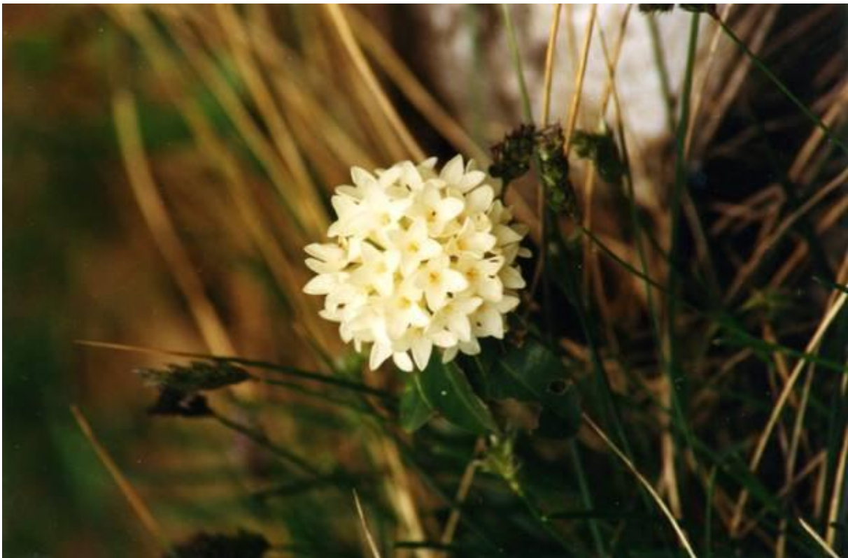
Die Königsblume ( Daphne blagayana ) am Vanga-Felsen (Schuler).

Die Karpaten sind etwas Besonderes! Es besticht nicht nur die Vielfalt – von sanften ansteigenden Hügeln, zerklüfteten Kalksteinmassiven, über in riesigen kristallinen Schiefer- oder Granitblöcken „zerbröselte“ Massive (wie das Retezat-Gebirge) bis hin zu Höhenzügen aus vulkanischem Gestein und aus Konglomeraten - eine bunte geologische Vielfalt. Ihre Urwüchsigkeit und die außerordentliche Vielfalt der Fauna und Flora prägen den Charakter dieser Landschaften. Da können im Fogarascher Gebirge und am Königstein noch Gämsen gesehen werden; im Spätherbst röhren in den Wäldern die Hirsche; wenn man Glück (oder Pech?) hat, begegnet man auch Bären, deren es in den Karpaten noch 5000 geben soll. Wölfe, Luchse und Wildkatzen sieht man indessen kaum, viel zu scheu ist diese Wildart..