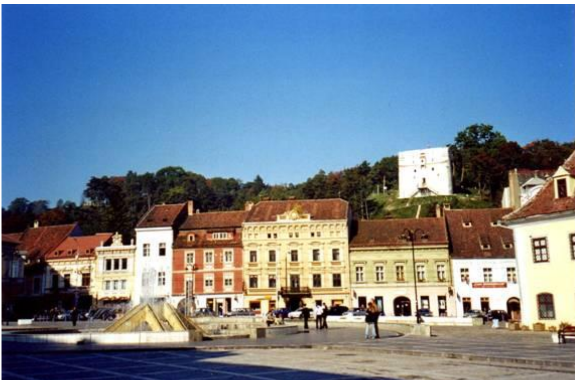
Flachszeile am Marktplatz von Kronstadt, im Hintergrund rechts, am Hang des Raupebergs, der Weiße Turm und links die Aussichtswarte.